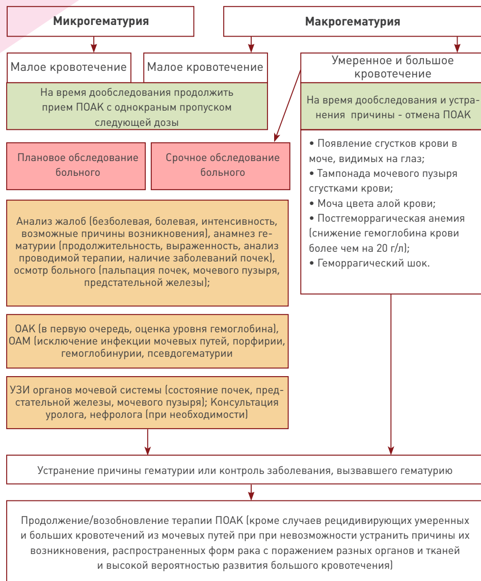
Рисунок 3. Алгоритм ЕАТ по тактике в отношении ПОАК при гематурии